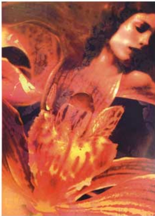
EVE IN TRANSFORMATION

ציור אקריליק על עץ | גודל: 100 ס"מ על 75 ס"מ