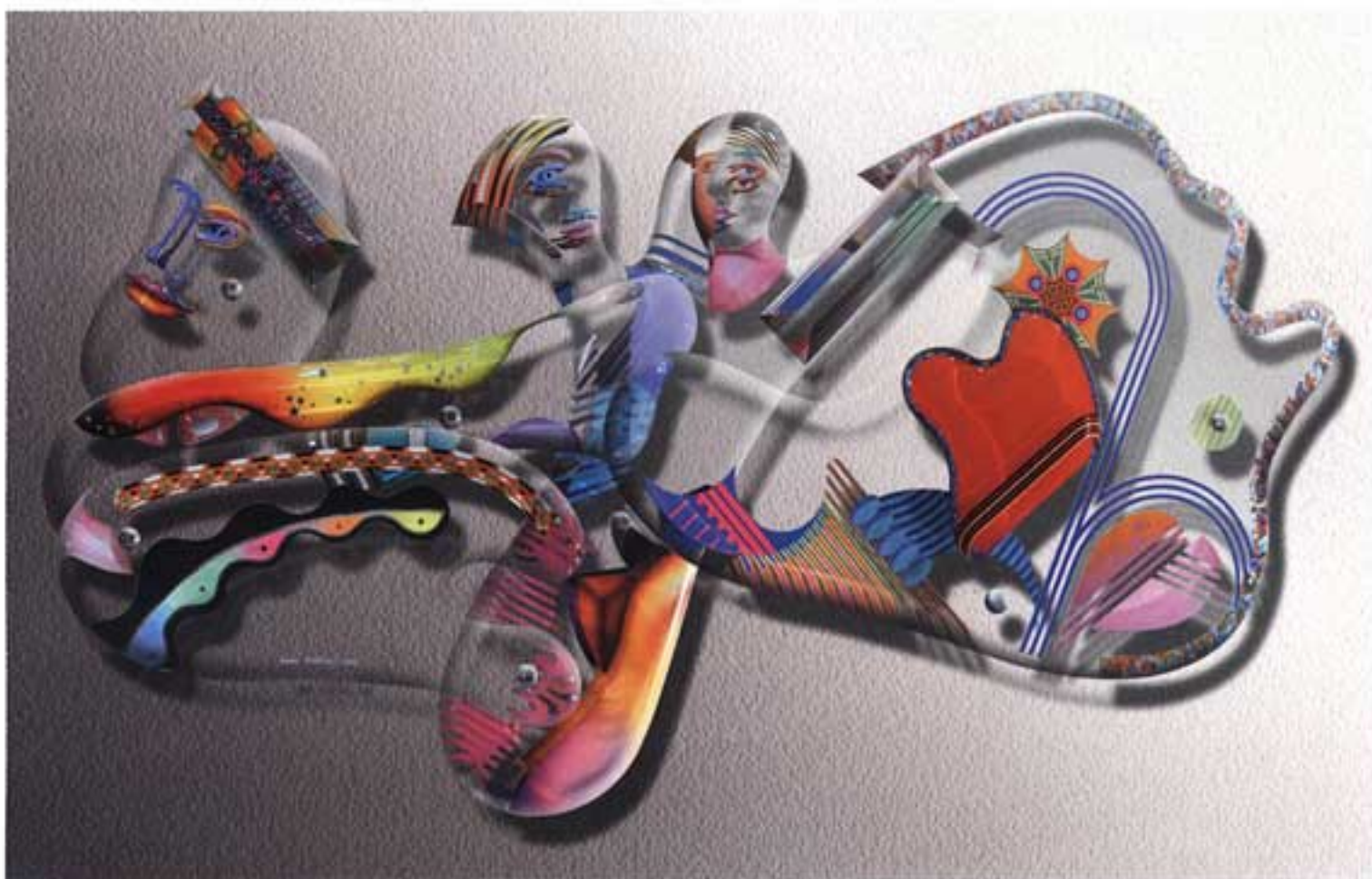
ODYSSEY | פסל אקריליק לתליה | גודל: 130 ס"מ על 60 ס"מ