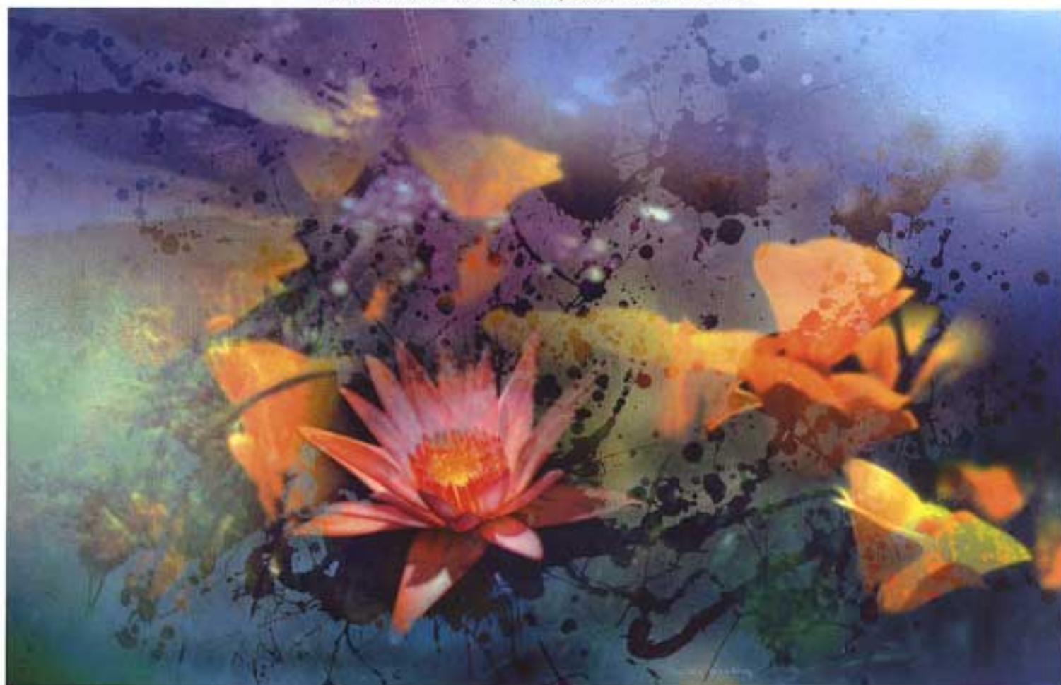
ציור אקריליק על עץ | גודל: 74 ס"מ על 115 ס"מ | LANDSCAPE