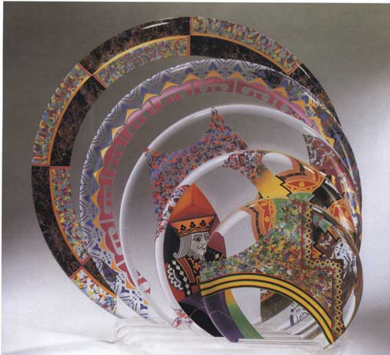
MEXICAN HOLIDAY | פסל אקריליק | גודל: 84 ס"מ גובה