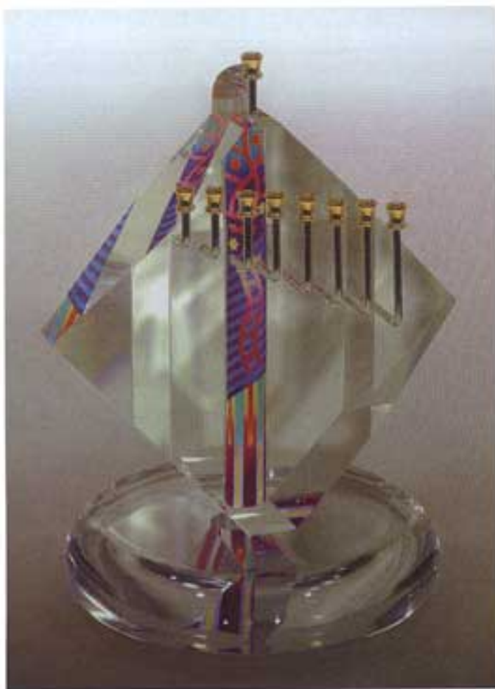
חנוכה | אקריליק רב מימדי | גודל: 33 ס"מ גובה