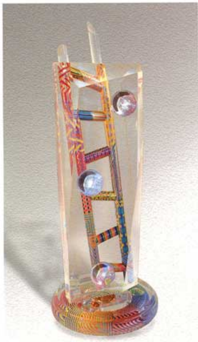
HEAVENS TOUCHED | פסל אקריליק | גודל: 99 ס"מ גובה

וכך הוא מתאר את יצירתו: "אני כמו שף המערבב יחד מרכיבים מעולמות שונים ויוצר ארוחה שאיש לפני לא בישל. הצבעוניות הרבה בציוריי משקפת את היותי אדם מאושר ושמח. אם לא אבטא את השמחה בעבודתי, לא אהיה אני, ולכן זו לא תהיה אמנות טובה, אמן יוצר על פי הרגשתו ומצב רוחו באותו הרגע. אני מעריך את היופי בדברים הפשוטים בחיים. הללו יכולים להיות במציאות בגודל של סנטימטר או שניים, ואני מעניק להם ממדים משמעותיים על גבי קנווס גדול... הסיבה לשמחתי היא שבפעם הראשונה בחיי אני נכנס לסטודיו, מביט בעבודתי ושמח על שהיתה לי היכולת ליצור אותן. לפעמים אני חושב לעצמי שהיוצר מוכרח להיות מישהו הרבה יותר טוב ממני. תהליך היצירה הוא לא תמיד גן עדן, לעתים הוא גיהנום, ולא פעם אתה זורק את המכחול בכעס. כיום הרגשתי היא שאני מבטא את עצמי טוב בהרבה מבעבר, לאחר הרבה שנים של מאבקים".