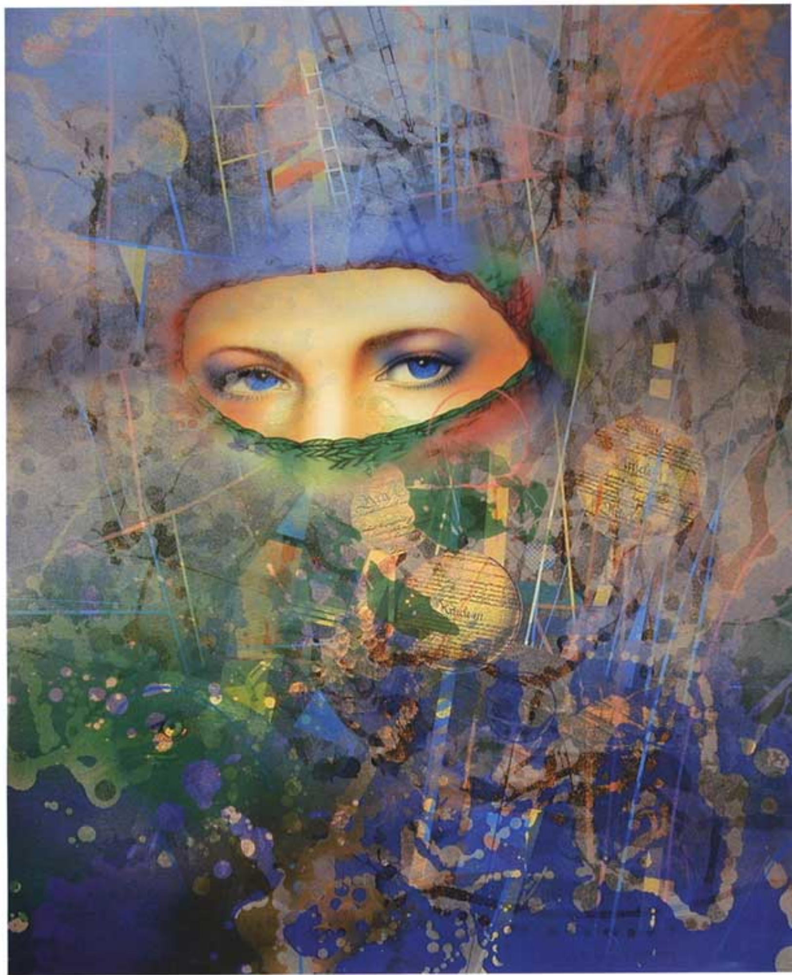
MYSTERIOUS | ציור אקרליק על לוח עץ | גודל: 51 ס"מ על 61 ס"מ