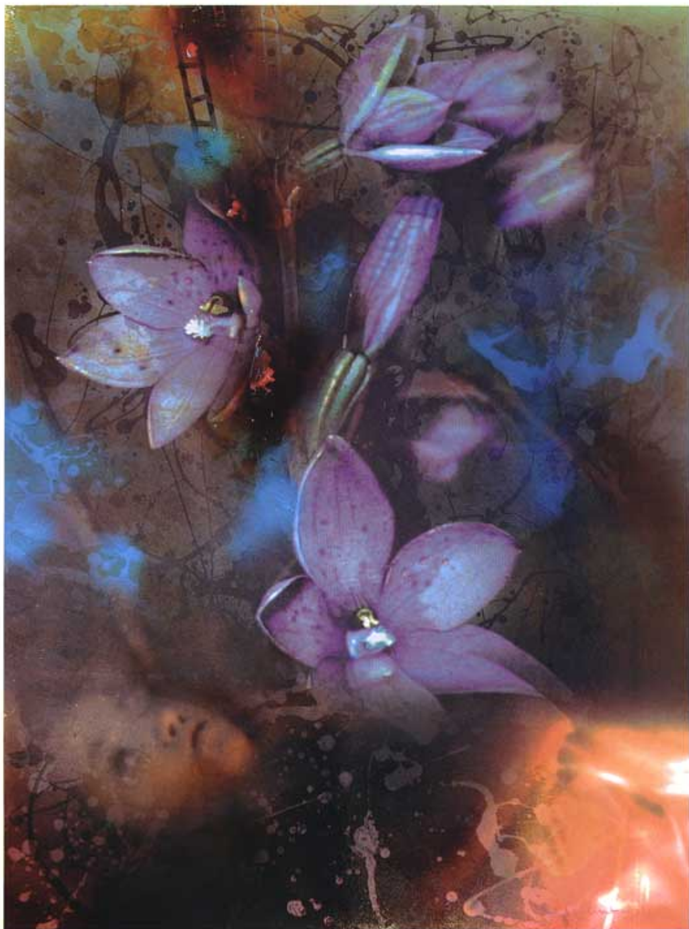
NIGHT DREAMS | ציור אקריליק על עץ | גודל: 102 ס"מ על 76.5 ס"מ

"אני כמו שף, מערבב ביחד מרכיבים מעולמות שונים ויוצר ארוחה שאף אחד לא בישל לפני מעולם. כשמסתכלים על עבודותי רואים שניסיתי לבטא כל מה שראיתי בחיי."