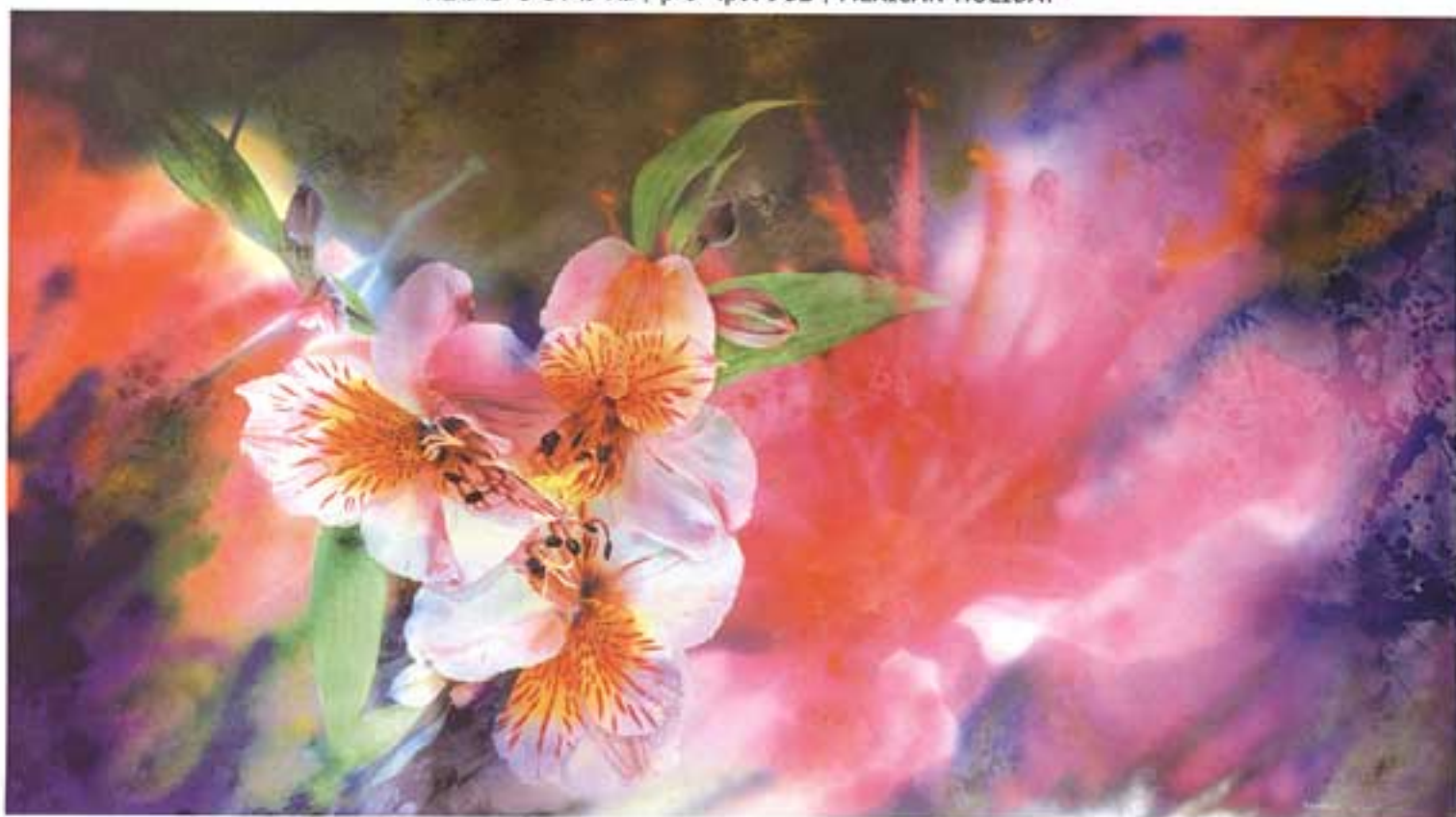
EXQUISITE | ציור אקריליק על קאנוס | גודל: 214 ס"מ על 122 ס"מ