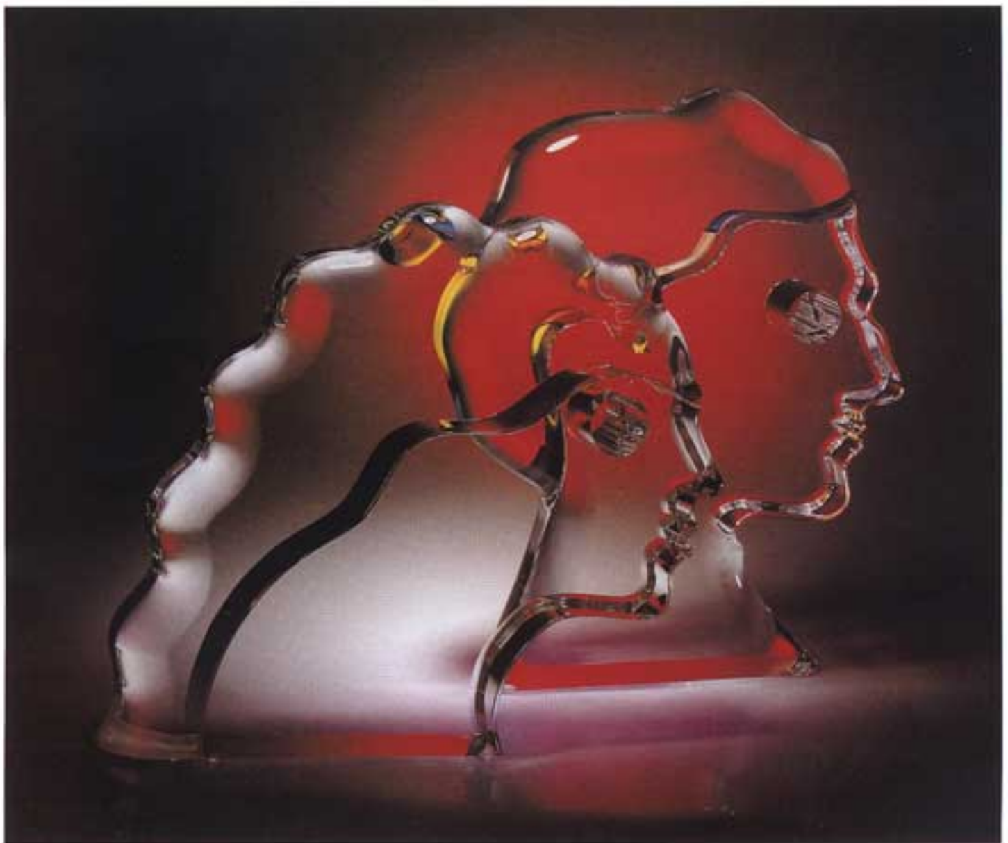
אדם וחוה | פסל אקריליק כפול | גודל: 43 ס"מ גובה

אמנים, אספנים, כוכבי בידור, פוליטיקאים ושועי עולם משחרים לפתחו וקונים את עבודותיו היחודיות והמודרניות. עד כמה גדולה הערכה והכבוד להם זוכה האמן הישראלי, אפשר להבין מעיון ברשימת האספנים מוקירי עבודותיו וידידיו - ובהם סלבדור דאלי, יעקב אגם, משה קסטל, הרמן ווק, דונלד טרמפ, ברברה סטרייסנד, ביל קלינטון, גורני בוש, בוריס ילצין, יצחק רבין, אנוואר סאדאת והמלך חוסיין ועוד רבים אחרים. עבודותיו מפארות משרדים ובניינים של חברות ציבוריות ופרטיות מובילות בעולם. הצלחתו נובעת מהשמחה הבאה לידי ביטוי בעבודותיו הצבעוניות והנועזות ומהשימוש בחומרים יחודיים. גינזבורג מצייר בשמן, באקריליק ובאקוורל על גבי קנוס או עץ, וכן יוצר פסלים מצוירים על גבי זכוכית או אקרילק, עומדים או לתלייה על קיר. ◀