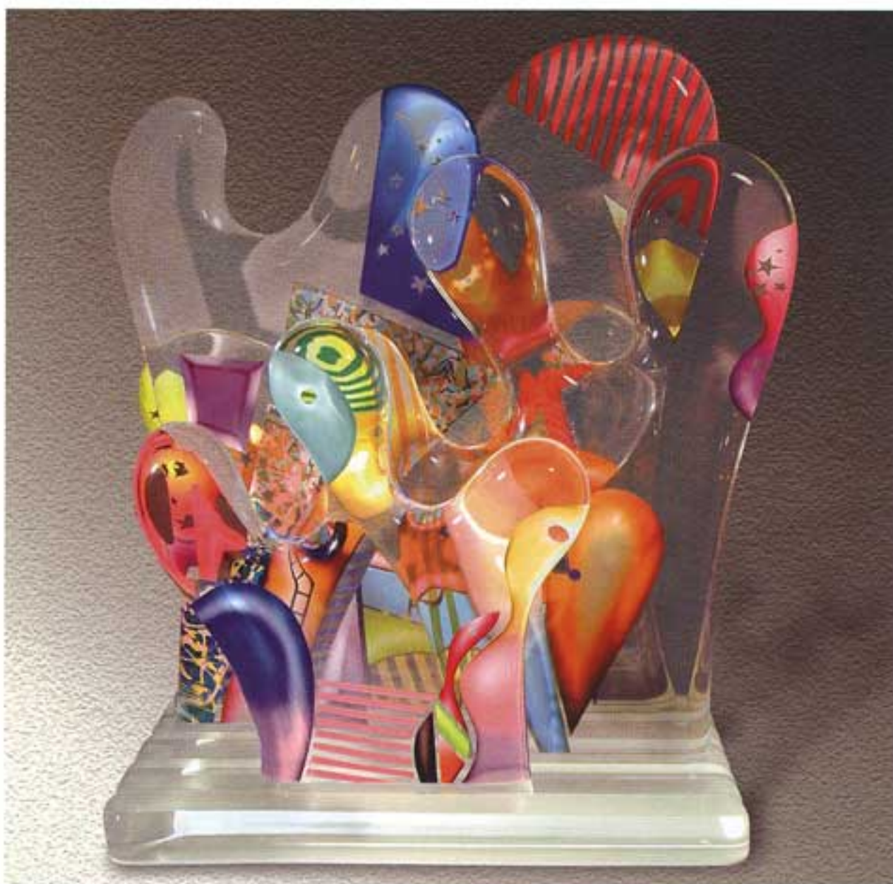
פסל אקריליק | גודל: 76.5 ס"מ גובה | COMPLETED